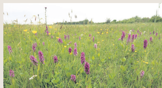
▲ In blauwgraslanden komen meerdere soorten orchideeën voor.

karakteristieke soorten. Het totale oppervlak van dergelijke hooilanden in Nederland is ingekrompen van tienduizenden hectares tot minder dan honderd hectare, in België en Noordwest-Duitsland zijn ze zo goed als verdwenen.