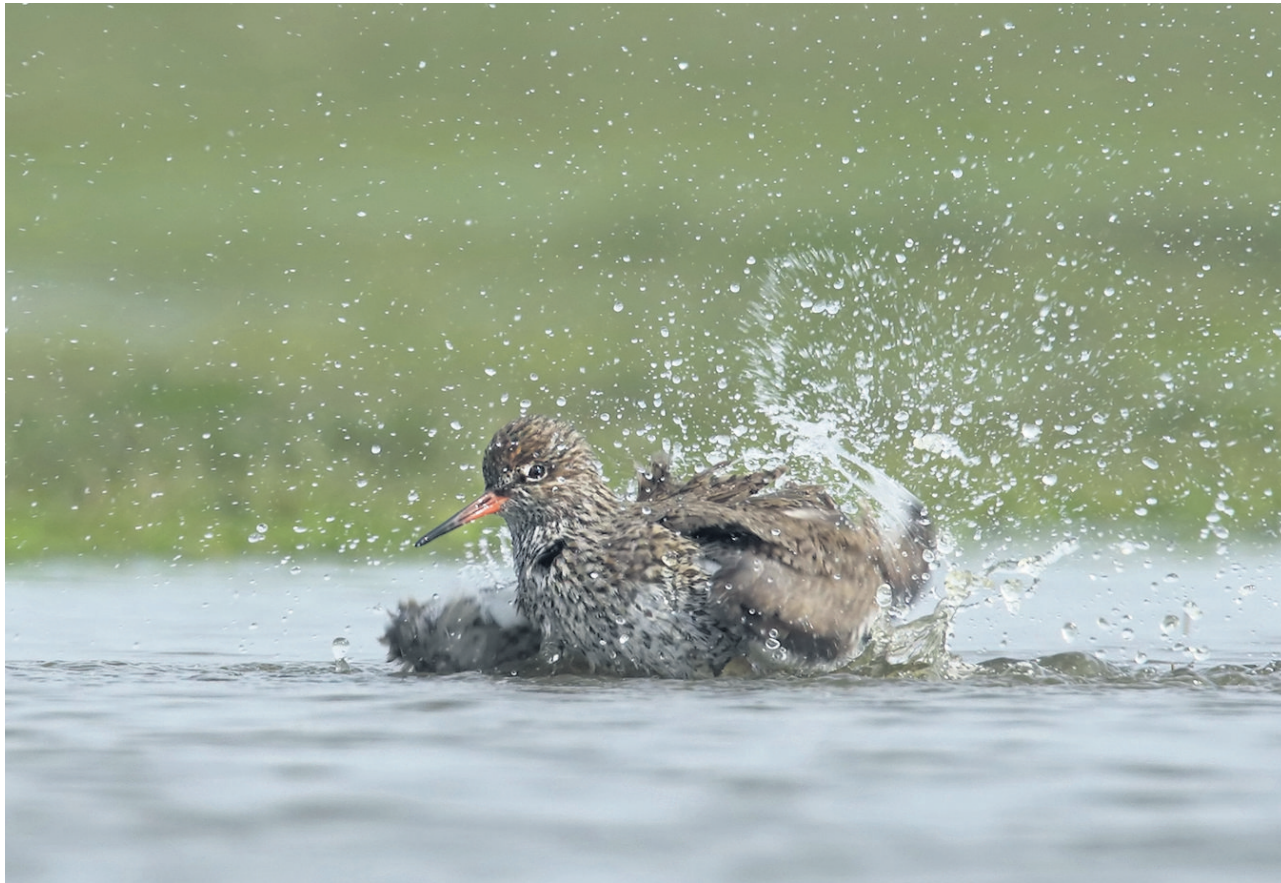
▲ Een tureluur neemt een bad in de langgerekte, ondiepe waterplas.

Weidevogels zitten in de verdrukking. In de Alblasserwaard helpt Staatsbosbeheer deze vogels een handje door een graslandperceel langs de Geerweg blank te zetten. „Het perceel regent vol en is zeer ondiep, hetgeen ideaal is voor jonge weidevogels.”